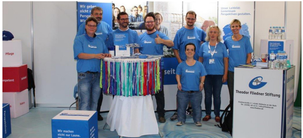
Hoch engagiert und zufrieden mit wertvollen Begegnungen auf dem Kirchentag in Dortmund: Das Messe-Team der Theodor Fliedner Stiftung.